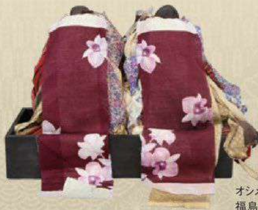
オシメサマ 館蔵 福島県喜多方市