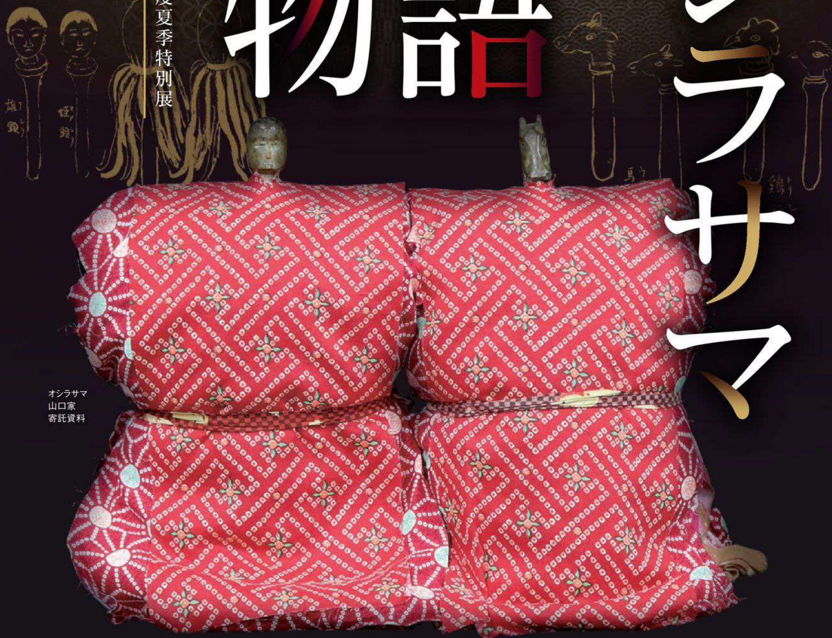
オシラサマ 山口家 寄託資料