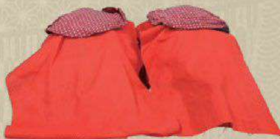
オシラサマ 前川家寄託資料