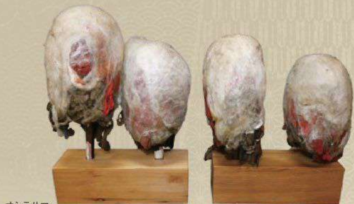
オシラサマ 岩手県立博物館 蔵 岩手県二戸市浄法寺町