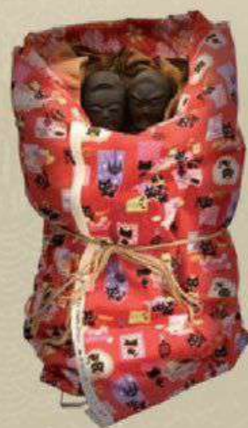
オッシュサマ 陸前高田市立博物館 蔵