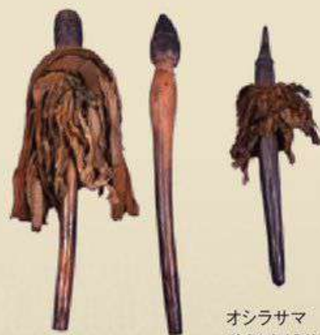
オシラサマ 碧祥寺博物館 蔵