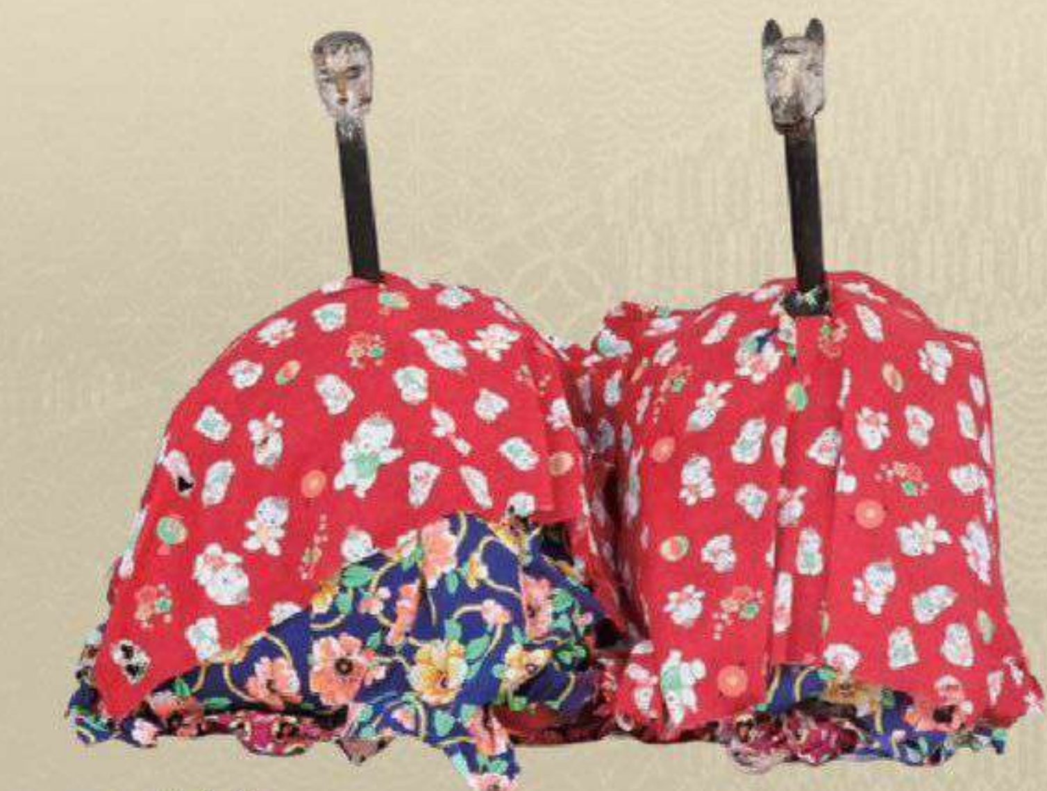
オシラサマ 福泉寺 蔵 佐々木喜善の生家で祀られていたもの