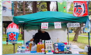
三陸夢を稔らせる会